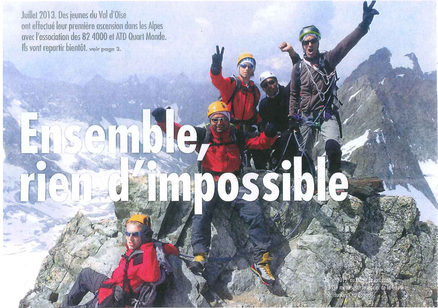
Juillet 2013, au Dome de la Lauze à 3359 mètres sur le glacier de la Grosse